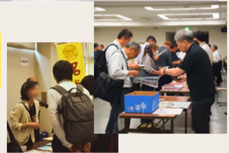
過去の交流会の様子